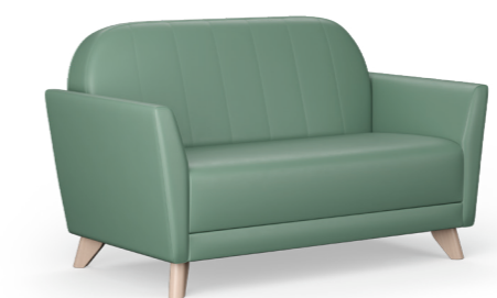
Henley 2-Sitzer Füße aus massiver Birke: 1HNW2-200 Füße aus Chrommetall: 1HNM2-200

86,3 H | 83,7 B | 78,3 T (cm) Sitzhöhe: 43,3 cm Gewicht: 32 kg