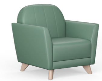
Henley Sessel Füße aus massiver Birke: 1HNW1-200 Füße aus Chrommetall: 1HNM1-200

86,3 H | 83,7 B | 78,3 T (cm) Sitzhöhe: 43,3 cm Gewicht: 32 kg