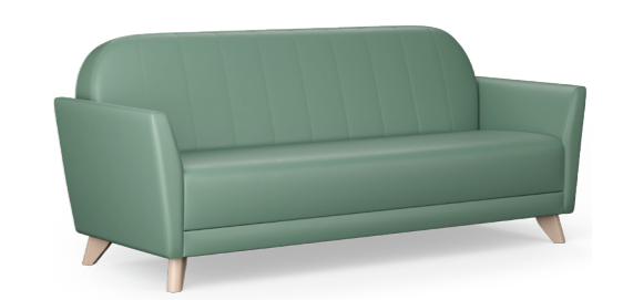
Henley 3-Sitzer Füße aus massiver Birke: 1HNW3-200 Füße aus Chrommetall: 1HNM3-200

86,3 H | 143,2 B | 78,3 T (cm) Sitzhöhe: 43,3 cm Gewicht: 46 kg