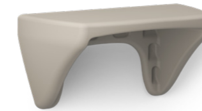
Ryno wandhängender Schreibtisch 1RYWD-00 60 H | 120 B | 59,7 T (cm) Gewicht: 16 kg