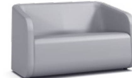
Sigma Plus 2-Sitzer 1SIGP2-900 80 H | 135 B | 70,8 T (cm) Sitzhöhe: 44 cm Gewicht: 51 kg