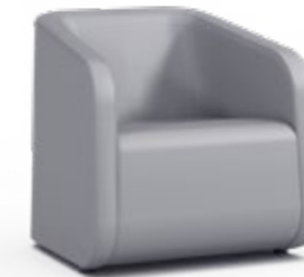
Sigma Plus Sessel 1SIGP1-900 80 H | 80 B | 70,8 T (cm) Sitzhöhe: 44 cm Gewicht: 36 kg