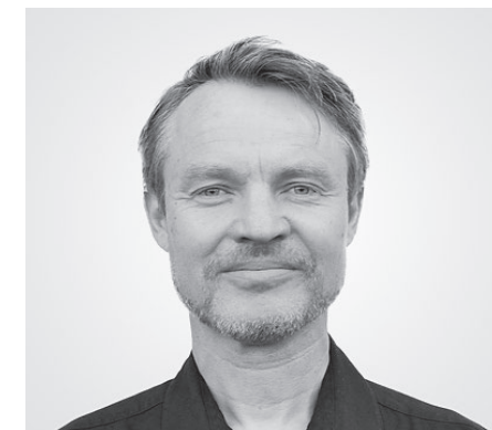
Design von Magnus Nero

Doorne ist ein vielseitig einsetzbares, modulares Sitzgruppen-System, das Ihnen hilft die zur Verfügung stehenden Räumlichkeiten optimal zu nutzen.