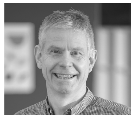
Design von: Ingemar Jonsson

Als wir unser Ryno® Sortiment entwickelten, war es unser Ziel, Möbel zu schaffen, die zuverlässige Sicherheit und Langlebigkeit mit einem freundlichen, einladenden und wohnlichen Aussehen verbinden.